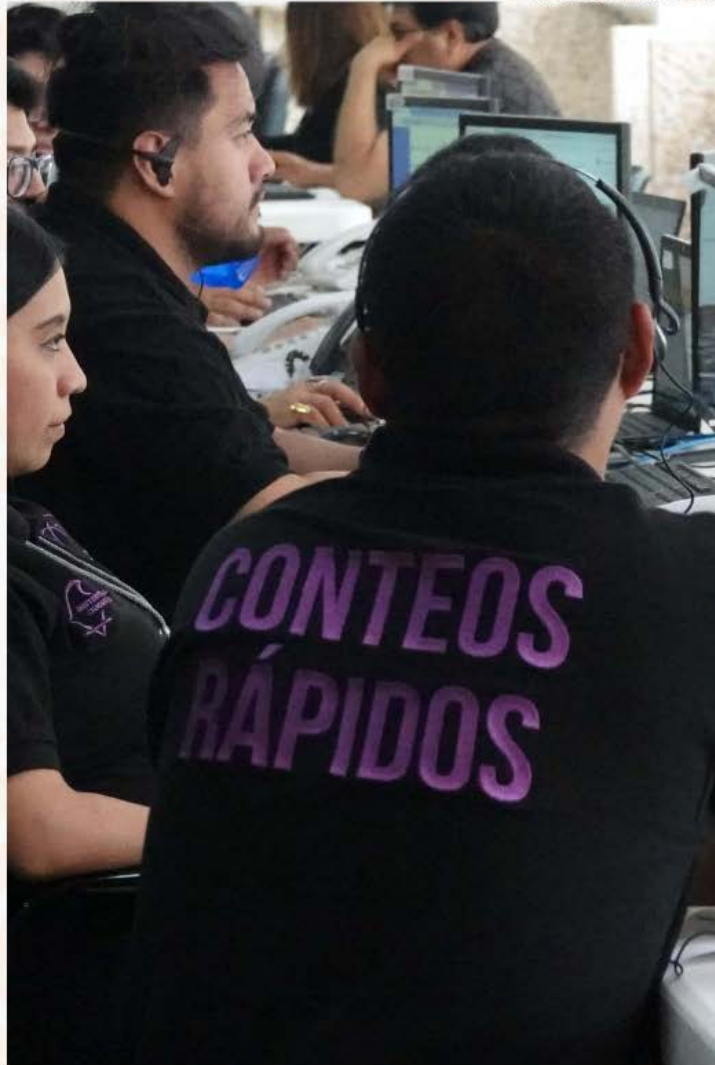
Esta jornada electoral será la primera en tener resultados con criterios científicos.

Es importante no confundir el conteo rápido oficial del INE con una encuesta o con el PREP (Programa de