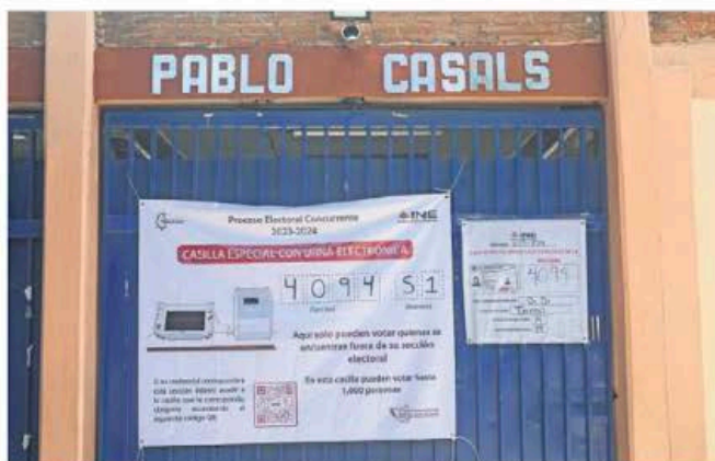
Las autoridades electorales están listas para el desarrollo de la votación; se prevé que los conteos rápidos se den entre las 22:00 y 24:00 horas.