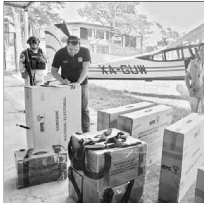
▲ El Instituto de Elecciones y Participación Ciudadana (IEPC) de Chiapas informó que hasta el jueves en la noche había entregado 5 mil 370 paquetes con papelería para los comicios de hoy, lo que representa un avance de 76.96 por ciento.

Mientras, el Organismo Público Electoral de Veracruz implementó medidas extraordinarias para garantizar la legalidad de los comi-